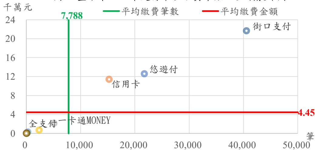
圖 3 臺中市 113 年支付平台繳費筆數及金額散佈圖